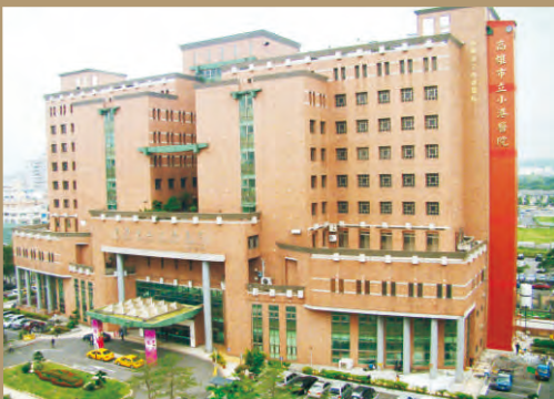
87年受高雄市政府委託經營高雄市長小港醫院