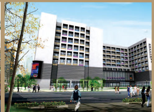
98年受高雄市政府委託經營高雄市長大同醫院