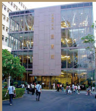
92年興建杜聰明紀念圖書館