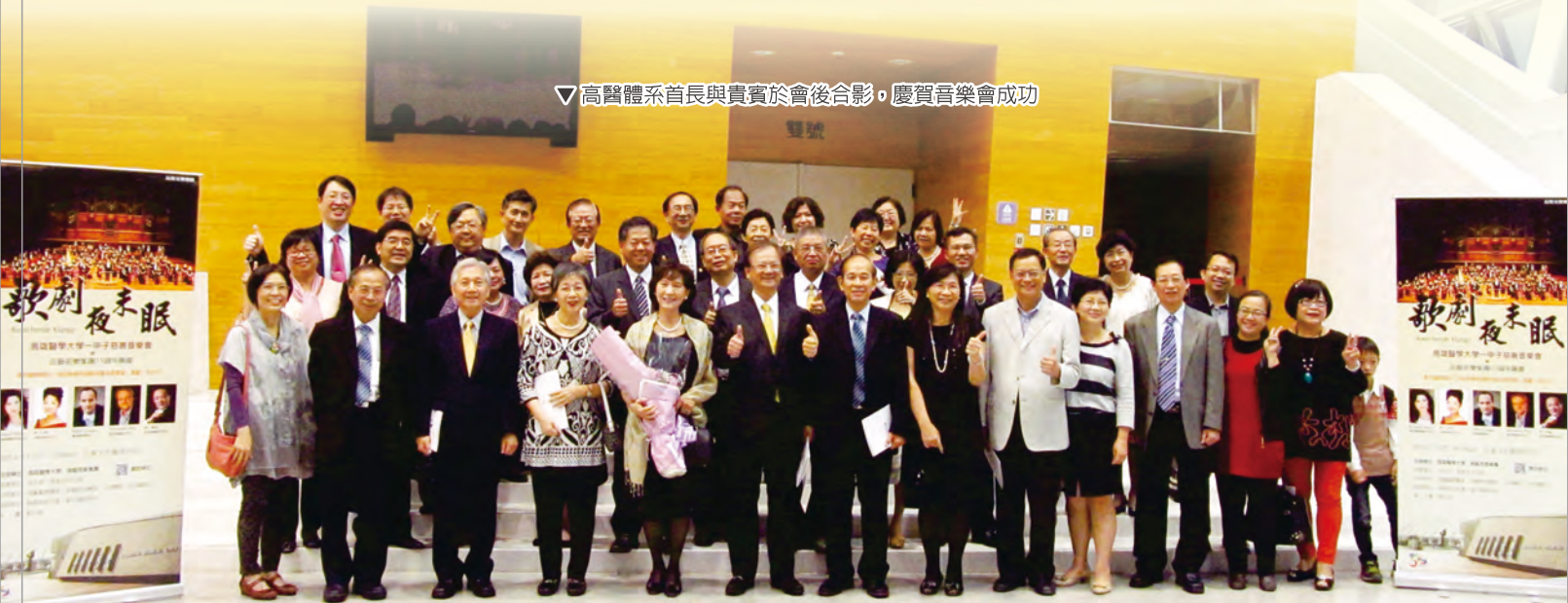
▽ 高醫體系首長與貴賓於會後合影，慶賀音樂會成功