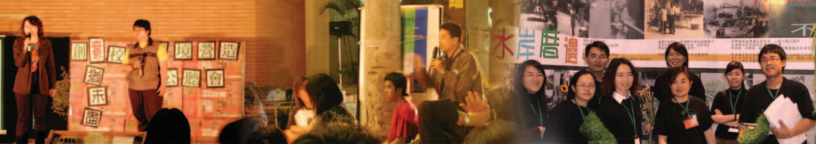
● 93年創造力教育博覽會合影

造的方法，營造使用者參與機制，推動校園環境營造運動受到評審團的肯定。「換心-舊三棟暨周邊環境營造行動計劃」獲得評審團的高度推薦並補助第二階段施作工程款，而「全方位健康升級-高醫大學城規劃」也以軟體策劃及實質空間規劃推動社區互動，結合社區資源，引領社區邁向大學城社區，榮獲執行績優。其中「換心」第二階段圖書館前廣場工程施作上，企劃