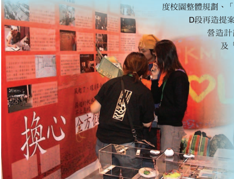
●93年創造力教育博覽會「換心」攤位解說