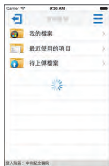
▲ (3) 雲端圖庫