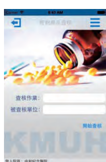
▲ (4) 管制藥品查核