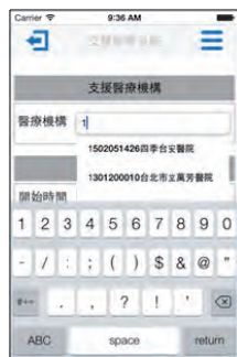
▲ (2) 支援報備